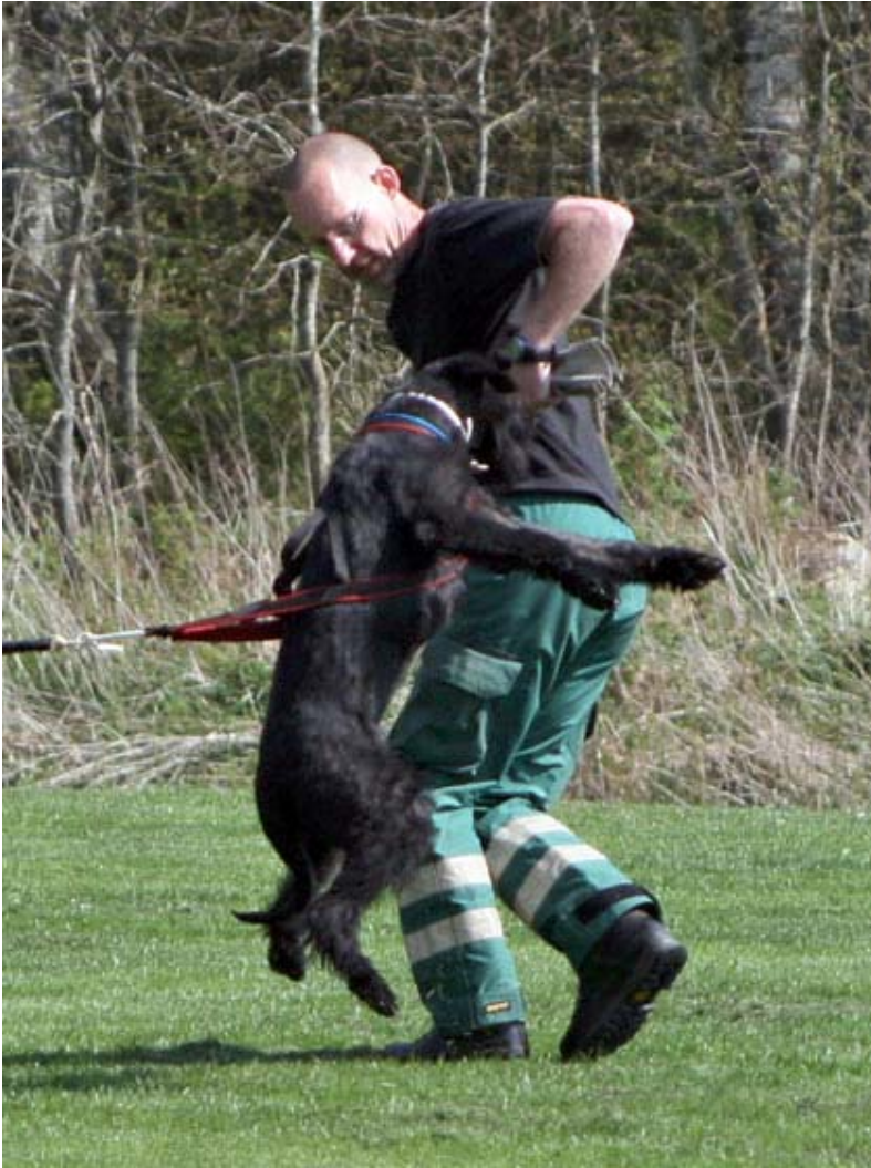
Kylie provar på lite bitövningar...