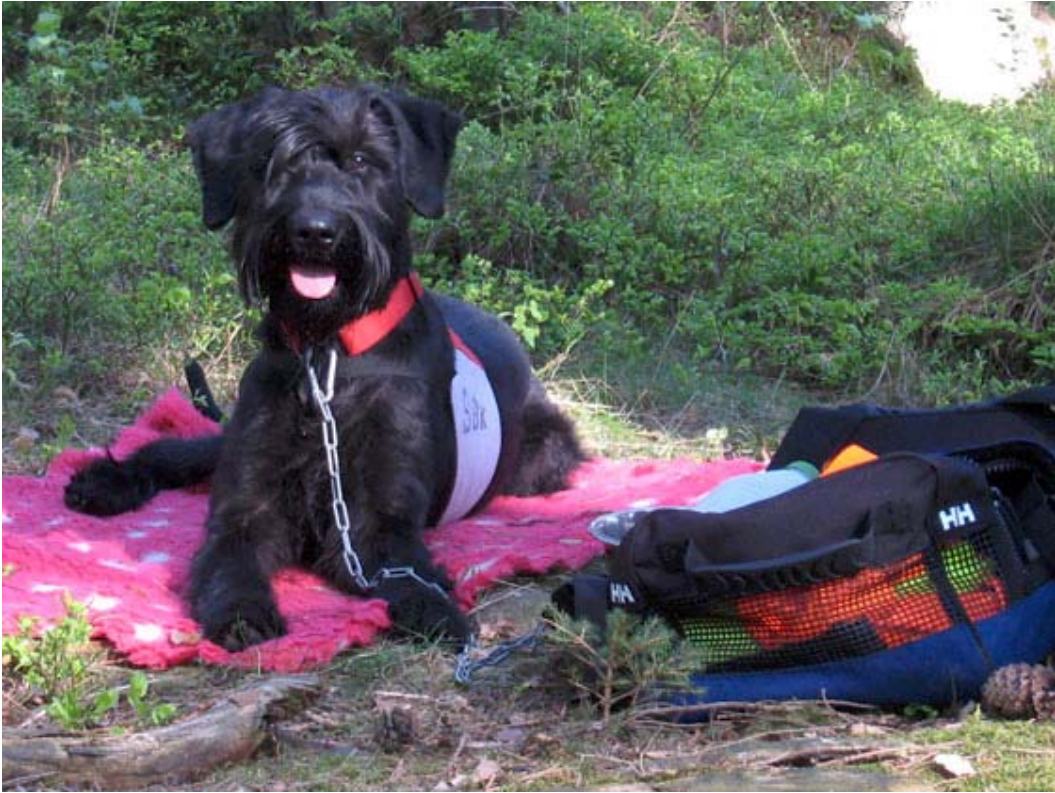
Kobra på A-station i väntan på nästa skick...