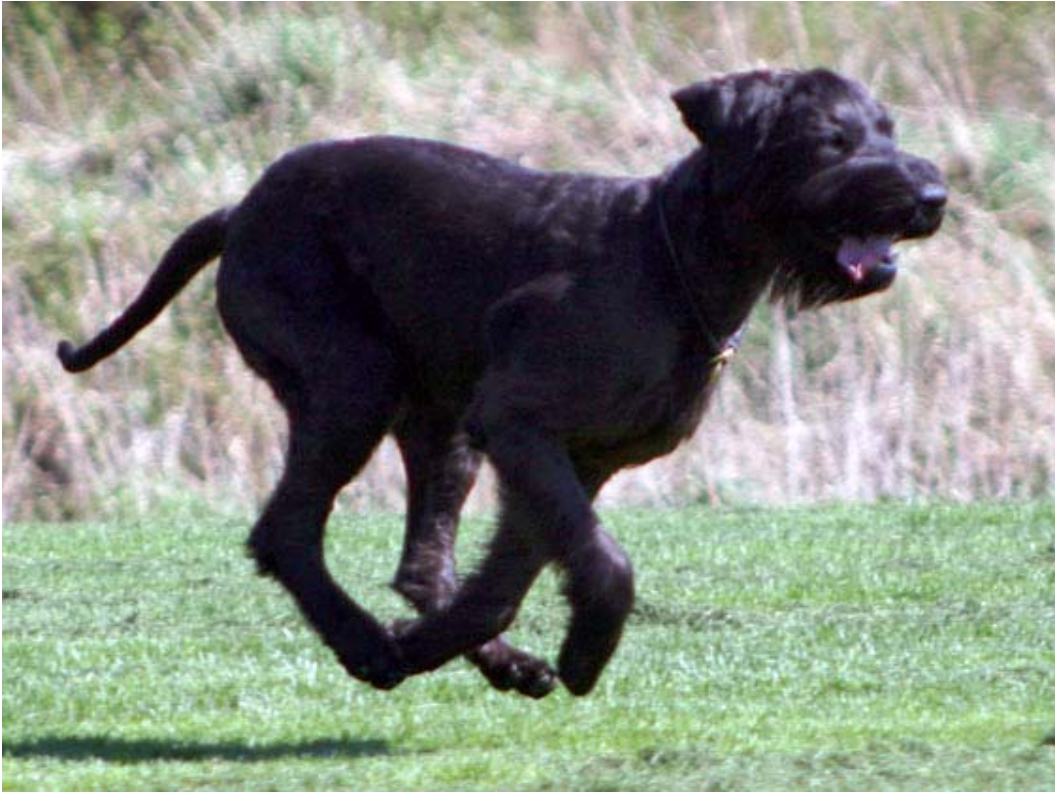
Kitty i full fart på budföringen...