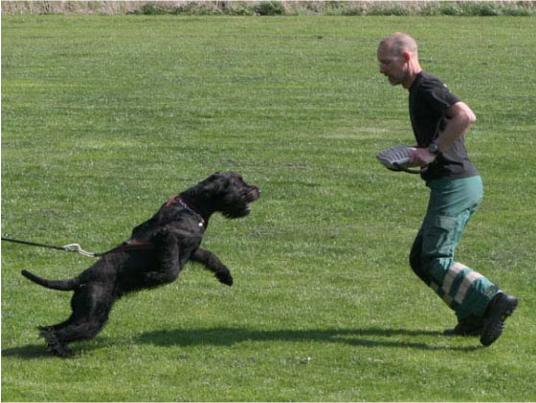
Kingston visade sig också ha talang i bitarbetet...