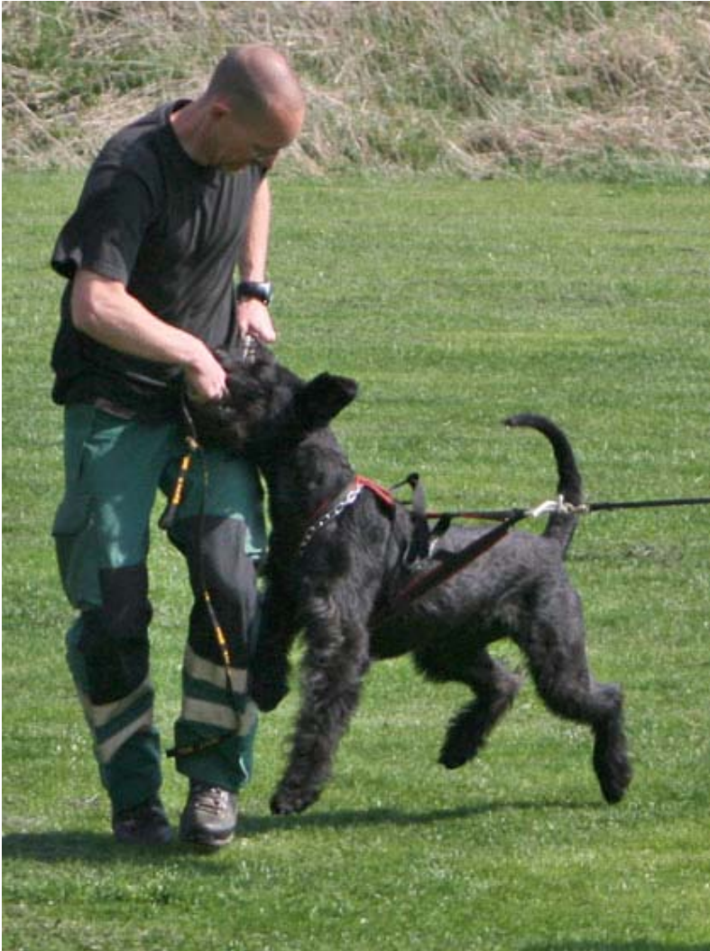
Kingston i bitskinnet...