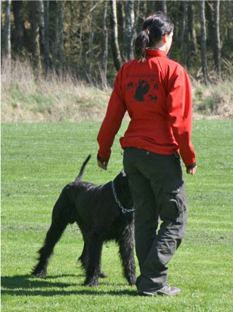
Ida och kingston gör sig klara för lydningsträning...