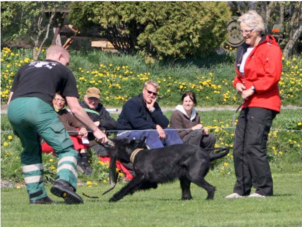
Även Fifi visade fint arbete i bitskinnet...